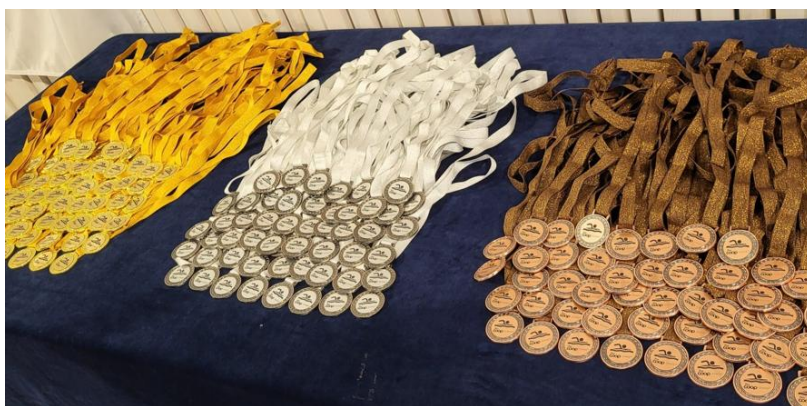
Medaljer vid Stora Coopsimmet 2024

Under 2024 har det varit 455 medlemmar varav 265 kvinnor och 190 män, föreningen har ökat antalet medlemmar med 72 st från 383 st föregående år. Antalet grupper har ökat med Delfinen och Silver-Pingvinen, Mastersgruppen och Kvinnosimning. Antalet simmande barn har också ökat i samtliga grupper. Därav har intäkterna men även kostnaderna ökat under verksamhetsåret. Ett antal projekt har påbörjats och avslutats och dessa har fallit väl ut, läs mer under projekt. Sponsorer till föreningen har gjort att våra kostnader har kunnat hållas till en lägre nivå än förväntat. Föreningens resultat och ställning framgår av efterföljande resultat och balansrapporter som finns tillgängliga i fristående bilagor till denna verksamhetsberättelse.