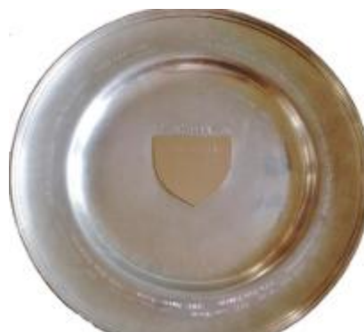
Stig Landströms vandringspris