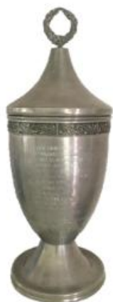
Gamla simmares vandringspris